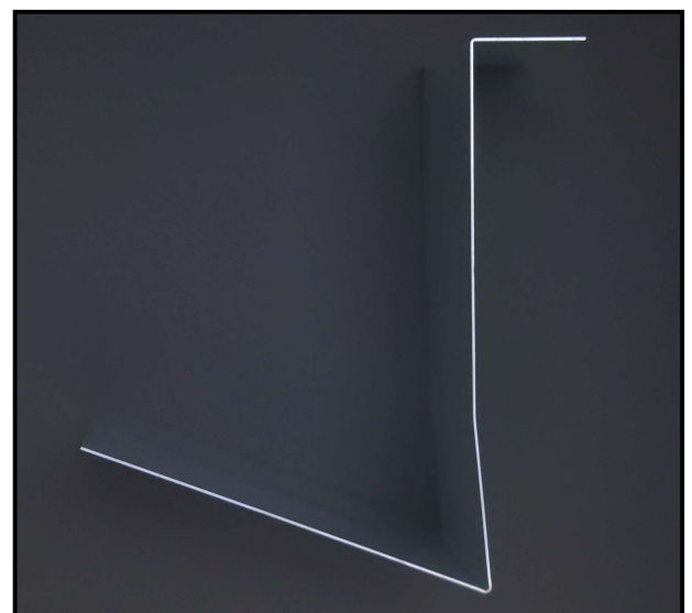
テンロックホルダーネオ